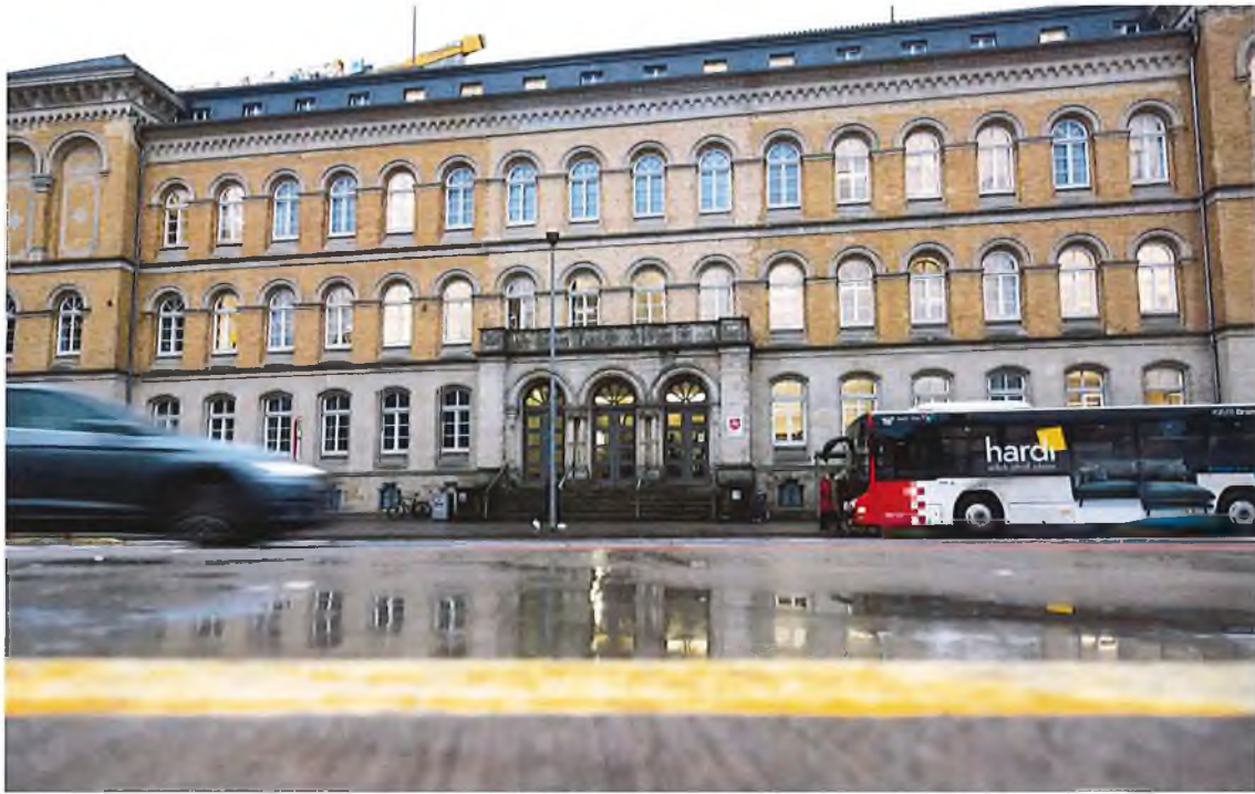
Das Landgericht in Osnabrück

Zum Prozessauftakt wirken die Angeklagten, die allesamt in Untersuchungshaft sitzen, eingeschüchtert. Während des ersten Verhandlungstages stellt die Kammer lediglich ihre persönlichen Daten fest. Anschließend verlas die Staatsanwaltschaft ihre Anklage. Zwei der drei jungen Männer stammen demnach aus Utrecht. Die Stadt in den Niederlanden gilt als Hochburg eines Netzwerks, das in Deutschland hunderte Geldautomaten gesprengt haben soll.